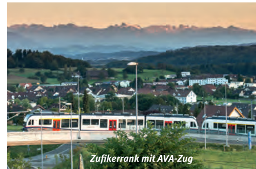
Zufikerrank mit AVA-Zug