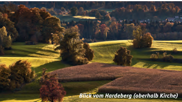
Blick vom Hardeberg (oberhalb Kirche)