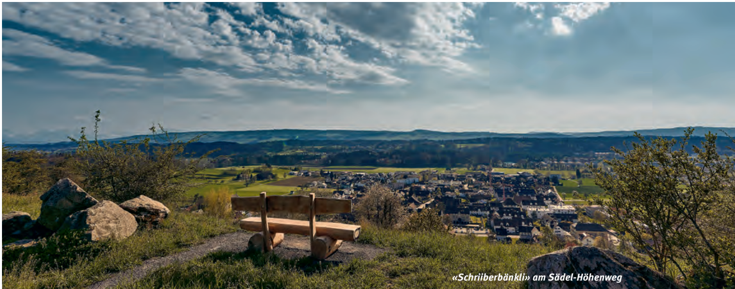
«Schriiberbänkli» am Södel-Höhenweg