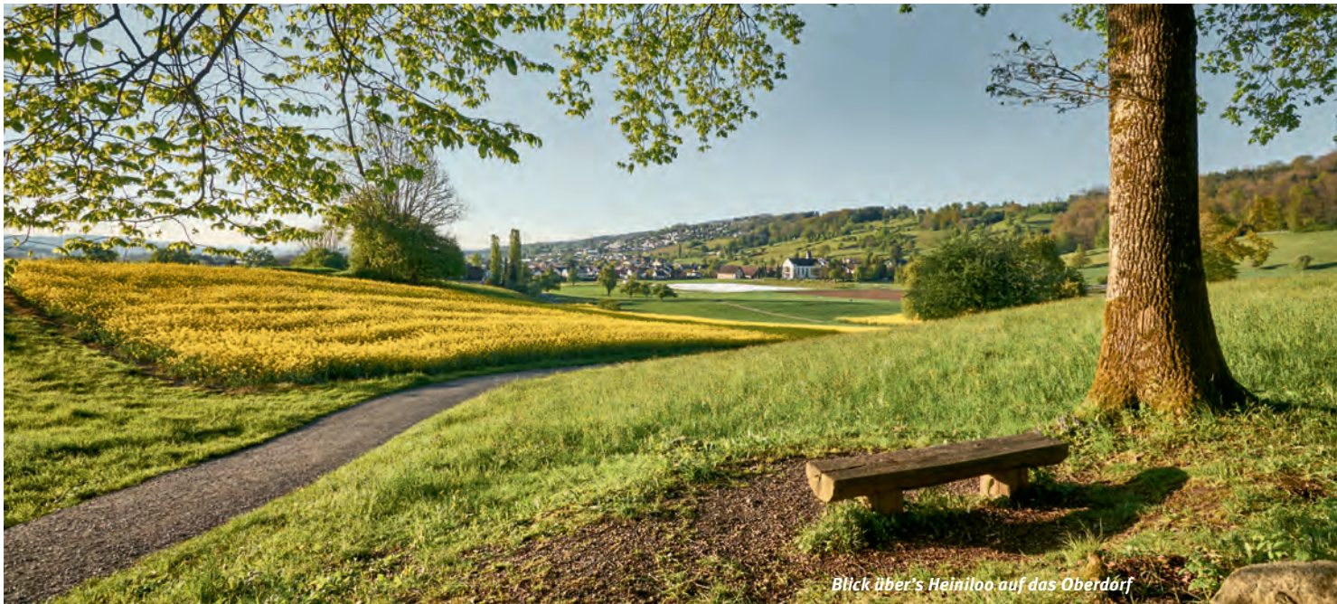
Blick über's Heiniloo auf das Oberdorf