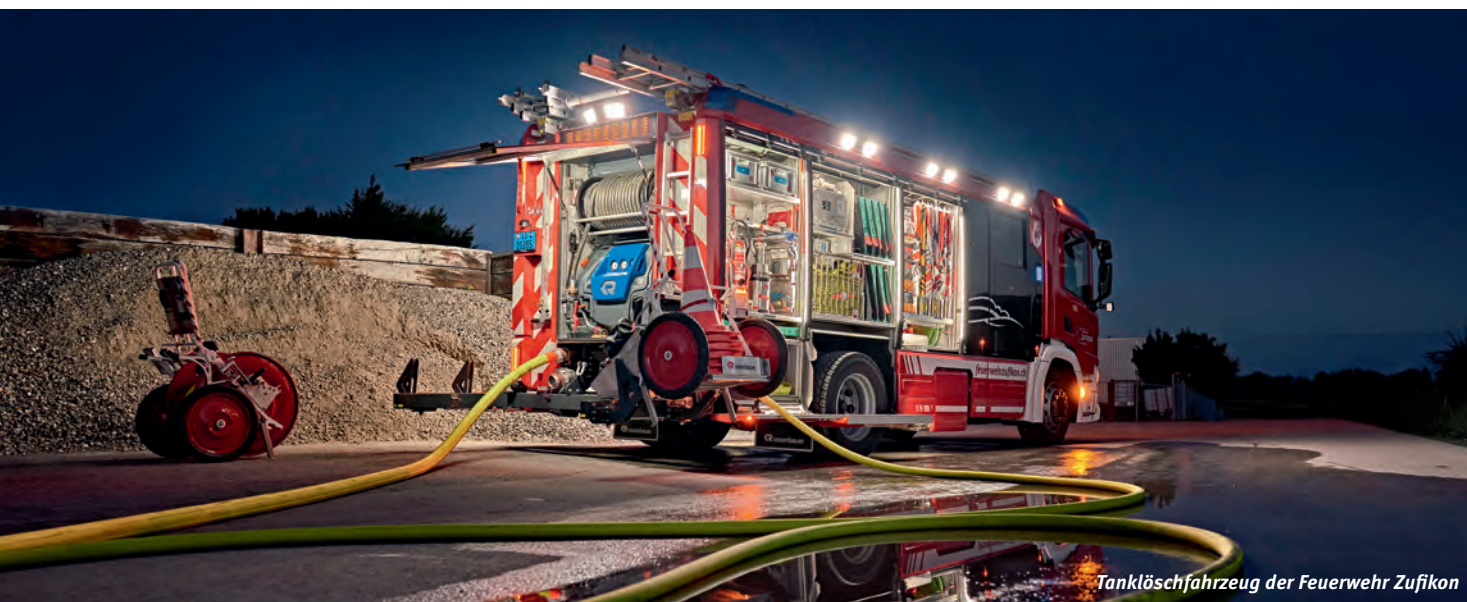
Tanklöschfahrzeug der Feuerwehr Zufikon

Die Feuerwehr Zufikon ist nicht nur bei Ernstfällen wie Feuer, Elementarschäden und Verkehrsunfällen vor Ort, sondern tritt auch aktiv bei der Prävention, beispielsweise bei Projektwochen der Schule, in Aktion. Nebst dem Auftrag in der Gemeinde arbeitet die Feuerwehr Zufikon eng mit den umliegenden Feuerwehren zusammen und ist auch in deren Alarmdispositiv eingebunden.