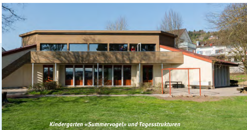
Kindergarten «Summervogel» und Tagesstrukturen