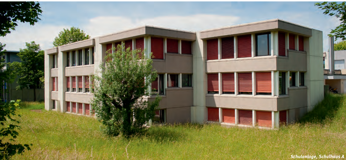
Schulanlage, Schulhaus A