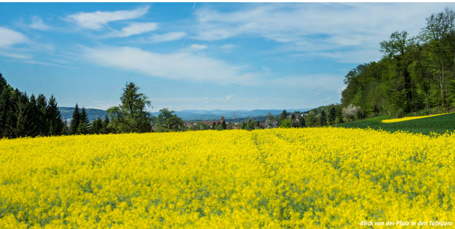
Blick von der Pfalz in den Tafeljura